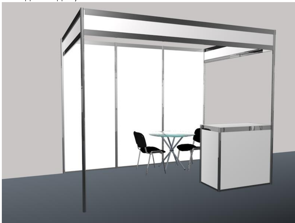
Пример стенда площадью 6м 2

Экспонент арендует стенд определенного метража, типа и минимальной комплектации мебели, необходимым для участия в Выставке.